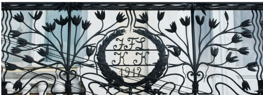
SÉTA A FÓTÉREN